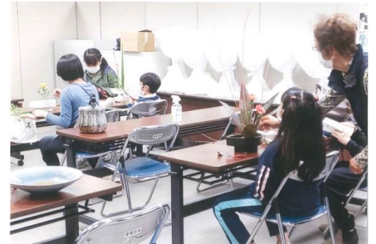
生け花教室では生け花を通じて親子の楽しい時間を過ごします。

はい、「親子でできる生け花教室」は基本第1・第3木曜日の月2回、ハートセンタービル（東町2-3-3）で、池坊の先生にご協力いただきながら開催しています。時間は17時30分から19時30分の間で自由なので、仕事を終えてから来るお母さんとお子さんでにぎわいます。もう一つ、同じくひとり親の親子を対象に夏休みの時期に親子レクリエーションの一環で「クルーザーボート体験試乗会」を開いています。定員10人ほどのクルーザーで港内から外海までを1時間ほどで巡るのですが、普段なかなか見ることのできない角度から室蘭の景色を楽しめる恒例行事で人気があります。ともに一般の親子等も参加可能です。募集は市の広報等を通じてご案内しますのでぜひご確認願います。