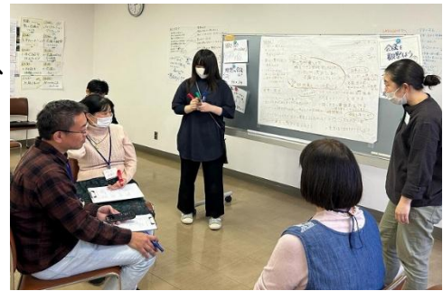
輪になって話し合いながら「話し合いのコツ」を学びます（写真は昨年11月の講座より）

今年も時期はまだ未定ですがファシリテーション講座を予定していますので、皆さまのご参加をお待ちしています。