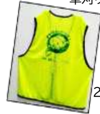
貸し出し用ビブス 20枚増えました。