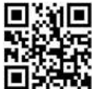
活センホームページ