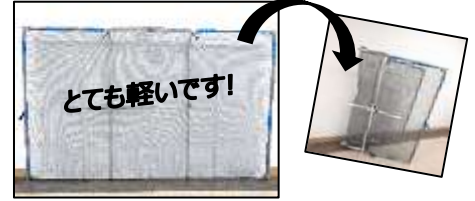
二つ折りにして運べる草刈り防護ネットです。